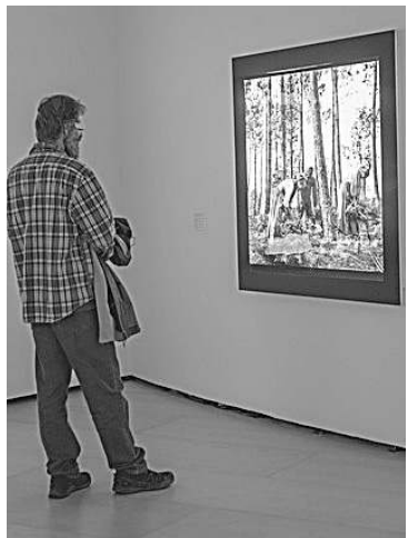
Jesus Etxebarriaren erakusketa. ARP

ARGAZKIGINTZA > XX. mende hasierako gizartea erretratatu zuen Jesus Etxebarria bilbotarrak. Argazki estereokopikoak egiten zituen, eta haietariko 14 jarri dituzte orain Guggenheim museoa. Bisitariak betaurreko berezi batzuk jantzita argazkiak hiru dimentsiotan ikusi ahalko ditu. Bilbon, Parisen eta Londresen harturiko irudiak, tartean.