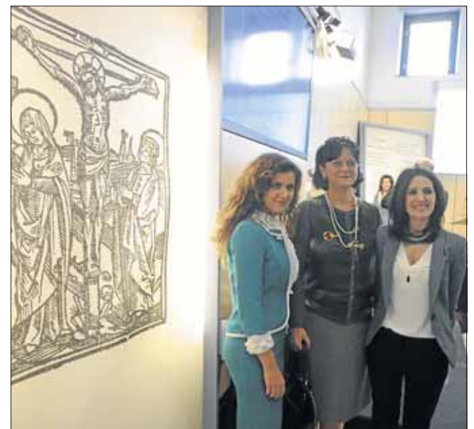
«Linguae Vasconum Primitiae» liburuaren aurkezpena.