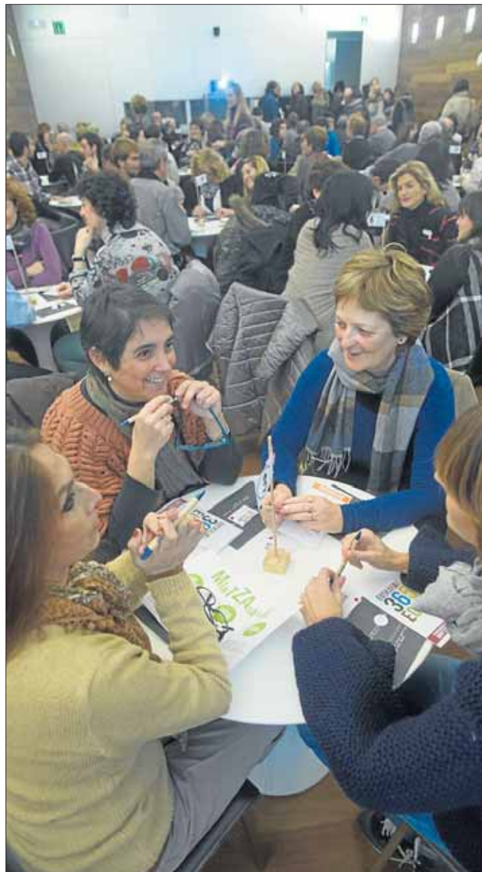
Donostiako San Telmo museoko mintzodroma.

EHEk, berriz, «ekintza ausartak eta eraginkorrak» eskatu zizkion lehendakariari, lehen baino beranduago desager daitezten, adibidez, euskaraz artatuak izateko eskubidea ukatzen zaien familien kasuak. «Mediku elebakarrak Jaurilaritzak jarri ditu», gogorazi zuten.